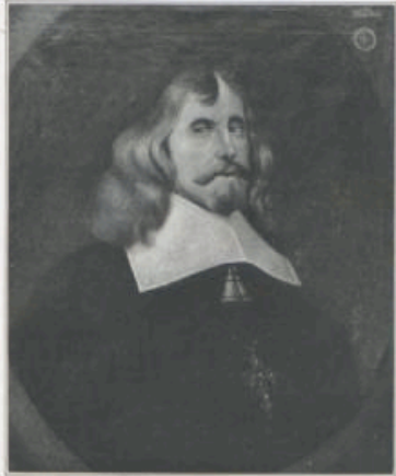
Johann Philipp von Schönborn, Kurfürst von Mainz und Fürstbischof von Würzburg und Worms