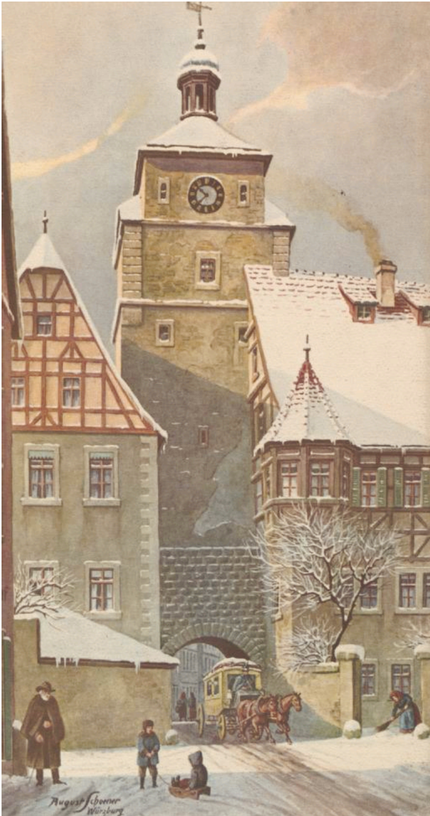
55/Franc 4105