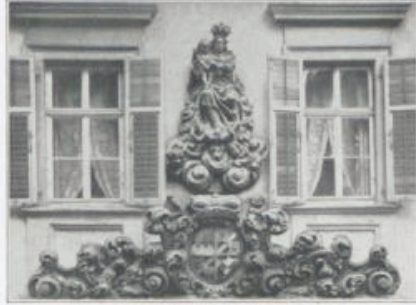
Haus Martinsgasse Nr. 5.

Bei einer Wanderung durch die Straßen und Gassen des inneren Würzburg wird man sich mehr und mehr überrascht fühlen von dem vielgestaltigen plastischen Schmuck, wie ihn nicht nur ansehnliche größere Höfe, sondern häufig auch kleinere bescheidene Baulichkeiten aufweisen können, vor allem über Eingangsportalen und an Straßenecken; alle diese verschiedenartigen Gebilde in ihrer Gesamtheit gewissermaßen ein Lesebuch, aus dem viel von der