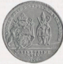
Der „Sergogaler“ des Fürstbisthofs Adam Seibrich v. Heinsheim.