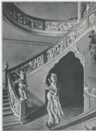
Aus dem Treppenhaus der Abtei.

letzterem Ort inzwischen neu aufgegangene künstlerische Gestirn, an Balthasar Neumann zu wenden. Auf ihn ist dann wohl die ganze weitere Durchführung bis zu ihrem Abschluß zurückzuführen. Und auch noch vor eine andere große Aufgabe sah er sich nicht allzu lang darnach in diesen Landen gestellt, vor die Ausführung großer Neubauten in Teresheim. Hier bewegte er sich dann ganz in dem ihm so besonders eigentümlichen Stil, im Rokoko, während hier in Schönthal noch keine Neigung zu diesen Formen hin bemerkbar ist. Eigentümlich genug war insofern das Verhältnis der Urheberschaft, als hier bei dieser Teresheimer Schöpfung Neumann darüber starb (1753) und andere ihm folgten, die dann leider seine großen Pläne durchaus nicht in vollem Maße zur Ausführung bringen konnten. Auffällig macht sich, weil es in dieser Zeit nur noch eine seltene Erscheinung ist, die Anlage als Hallenkirche. Die Altäre sind zum Teil aus der älteren Kirche herübergenommen, einige davon Werke von Angehörigen der