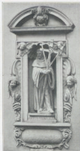
Brombacherstraße Nr. 1. (Text hier nicht ablesbar.)

Dieser große Seidenteppich, in fast quadratischer Form, hatte offenbar nicht von Anfang an seine nachherige Bestimmung. In dem besonders reich ausgeführten mittleren Teile befindet sich das von Truchsessische Wappen, darunter ein Pelikan in einem Goldnest; sodann ein Band mit der Inschrift: Veronica Magdalena Truchsessin v. Wz. und die Jahreszahl 1688, also eine Entstehungszeit, die über ein halbes Jahrhundert der Gründung dieses Damenstiftes vorausgeht. Die Bordüre ist jedenfalls älter als das Mittelstück und aus vier abgetrennten Bahnen gebildet. Seine Hauptanziehungskraft hat der Teppich durch die über seinen ganzen Grund verstreuten reizenden Blumen. Die Herstellung der photographischen Aufnahme und die Erlaubnis der Benützung für den vorliegenden Zweck verdanken wir der verehrlichen Museumsverwaltung, der hierfür ganz besonderer Dank ausgesprochen sei.