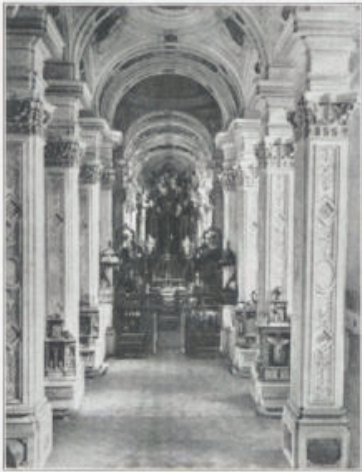
Innere der Kirche.

wurde. Erhebliche Meinungsverschiedenheit entstand über die Frage der künstlerischen Urheberschaft. Da kurz vorher in dem ebenfalls dem Bistumsorden angehörigen Kloster Ebrach durch ein Mitglied der nach Bamberg zuständigen Künstlerfamilie Dienzenhofer