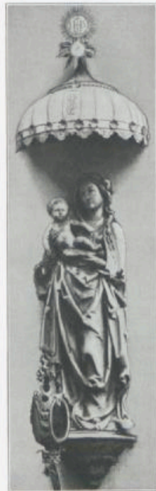
Bronnbachergasse Nr. 23.

frommen sinnigen Denkweise unserer Altvordere zu entnehmen ist. Wenn Scharold in seinem bekannten Buch „Würzburg und seine Umgebungen“ davon spricht, daß derartige Bildnisse immer mehr verschwinden, so kann daraus gefolgert werden, wie ebendem noch viel mehr derartiger Schmuck vorhanden war. Madonnenbildnisse sind darunter die überwiegende Mehrzahl, oft mit großer künstlerischer Anmut gefertigt; hat man ja doch die so viel verehrte Gottesmutter gern als „Herzogin von Franken“ gefeiert. Schon in unseren früheren Jahrgängen wurden gelegentlich Mitteilungen aus diesem Bilderschatze gemacht, aber immer wieder lenkt der Reichtum dieser Gebilde von neuem darauf zurück.