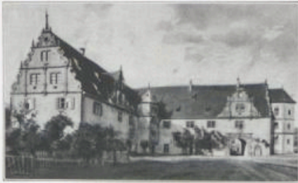
Aus der älteren Abtei.

Künstlerfamilie Kern aus dem nahe benachbarten Forchtenberg. Das Gemälde des Hochaltars stammt von dem bekannten Oswald Ungers. Sehr anmutend ist auch das schöne Abschlussgitter. Der an die Fassade sich anschließende neue Abteibau (1737—1750), in dem jetzt das für angehende protestantische Theologiestudierende bestimmte Seminar sich befindet, zeichnet sich vor allem durch ein bedeutendes Treppenhaus aus. In einem Festsaal dieses Hauses ein Freskogemälde von Asam; es hat also dieser auf dem Gebiete der