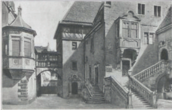
Partie aus dem deutschen Hof.

In dem Deutschen Hof, einem großen Gebäudekomplex, hat man vor allem den Sitz der ehemaligen Komturei des Deutsch-