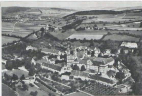
Ansicht aus der Höhe.

Als das würdigste Denkmal für diese ganze reiche Vergangenheit darf der imposante Klosterbau angesehen werden. Dabei muß