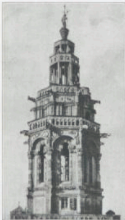
Vom Westtum der St. Kilianstirche.

rat dadurch wie an so vielen Orten in Verlegenheit und machtlos. Die Besetzung der Tore mußte den Bauern überlassen werden. Besonders übel hatte man den Klöstern und dem Deutschorden mitgespielt. Sogar Heilbronner Weiber unter einer eigenen Hauptmännin gehörten zu den Teilnehmern, während dagegen ein gewisser Lachmann, ein lutherischer Prediger, nicht ohne Erfolg zu vermitteln suchte. Aber damit nicht genug; um Mitte Mai schien Heilbronn die Bedeutung eines Regierungssitzes der Bauern gewinnen zu sollen. Abgeordnete der verschiedenen Haufen sollten hier den Plan zu einer Umgestaltung der deutschen Verfassung beraten; Friedrich Weygandt aus Mühlentberg und Wendel Hipler, zwei weit über das gewöhnliche Maß hinaus beanlagte Persönlichkeiten hatten die merkwürdigsten Reformpläne entworfen, die sogenannte „Ordnung Kaiser Friedrich III.“. Aber die bald darauf eintretende Wendung der Dinge hat dann all' diese kühnen Projekte völlig vereitelt.