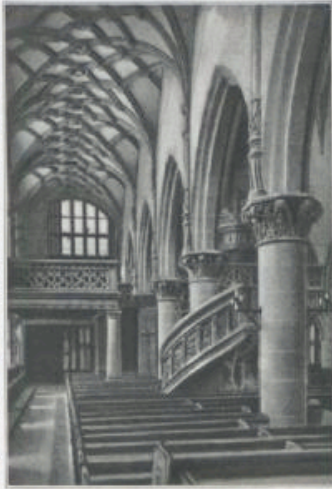
Aus dem Innern der St. Kiliankirche.