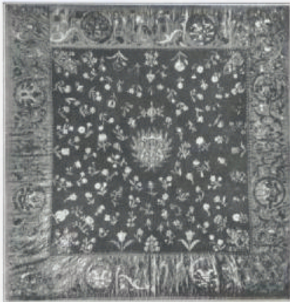
Aufschwörungsteppich von Waigenbach.

eine weitere Aufnahmebedingung. In Beobachtung der vita communis im Stiftsgebäude und Abhaltung von drei Bestunden in jeder Woche bewegte sich das Leben in diesem Stift, dessen Reichtümer an die Mitglieder übrigens von bescheidenem Umfang waren. Erst gegen Ende des 19. Jahrhunderts nahm die gemeinsame