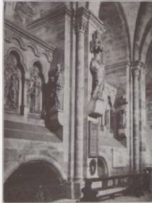
Aus dem Bamberger Dom.

Pommern bildete das Ziel seines Wirkens und die Kenntnisse und Beziehungen, wie er sie in früheren Zeiten in Polen und Böhmen gewonnen hatte, kamen ihm dabei sehr zu statten. Ein spanischer Bischof, der einst dort gewirkt, aber bei dem Mangel an den nötigen Mitteln nichts Bleibendes hatte schaffen können, lernte Otto kennen und sah in ihm alsbald den richtigen Mann für diese Aufgabe. Bischof Otto stand nicht an, einem solchen Rufe zu folgen und mit Zustimmung der dabei in Betracht kommenden Gewalten ging er mit heiligem Eifer, aber auch mit kluger Vorsicht unter Aufwendung entsprechender materieller Mittel an das Werk. Wechselnd waren die Erlebnisse und Erfolge, zuletzt aber doch so, daß er mit Recht als der Apostel der Pommern bezeichnet und gefeiert werden konnte. Unter allen späteren Wandlungen, wie sie in diesen Ländern eingetreten sind, ist sein An-