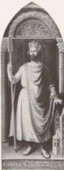
Kaiser Heinrich II. im Memorial zu Frankfurt a. M.

H ierne schauen wir, wie schon in unserem Vorwort ausgesprochen wurde, bei der jetzt so gesunkenen Machtstellung unseres deutschen Volkes zurück in jene Zeiten, da es stark und führend an der Spitze einer größeren Gemeinschaft, des Reiches der abendländisch-christlichen Völker und Reiche stand. Von solchen Anschauungen und Absichten war Karl der Große, der gewaltige Erneuerer der Kaiserherrschaft, bei dem Ausbau seines Reiches ausgegangen. Und nach der schweren Krise, wie sie dann unter den letzten Karolingern eingetreten war, hatte der erst durch Karl neu hinzugewonnene Stamm der Sachsen unter Otto dem Großen eine Wiederaufnahme und Weiterführung der großen Aufgabe übernommen. So glanzvoll nun auch unter den ersten Herrschern aus dieser Dynastie der Thronen ein wahrhaft kaiserliches Walten durchgeführt worden war, so hatte doch zuletzt unter dem reich begabten, aber zu phantastischer Schwärmerei hinneigenden Otto III. von neuem eine schwere Erschütterung gedroht. Aber diesmal war es der aus einem Nebenweig der Familie stammende Heinrich II., der jetzt vor den drohenden Riß sich stellte und seiner Regierung den Charakter einer Restauration aufprägte. Es ist einer der interessantesten Abschnitte in der Geschichte der deutschen Kaiserzeit. Im Jahre 1024, genau vor neun Jahrhunderten, endete das Leben Heinrich II. und damit zugleich diese sächsische Kaiserdynastie, also