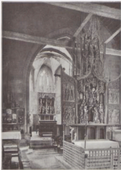
Der Riemenschneider'sche Altar in der Herrgottskirche.

vereinigenden Herrgottsbad durchströmt, haben wir die Spuren unseres Meisters zu suchen. Die durch ihre etwas erhöhte Lage schon von weiterher sichtbare „Herrgottskirche“ ist ein 1384 begonnener, noch auf hobenlohesche Stiftung zurückzuführender gotischer Bau, lange Zeit hindurch eine stark besuchte Wallfahrtskirche, später und bis heute den Zwecken einer Friedhofskirche dienend; reich mit Ephen bewachsen ist die Wirkung schon im äußeren ungemein malerisch, noch vermehrt durch ein zierliches Treppentürmchen in der Ecke zwischen Chor und Schiff, der sogenannten „Trepelkanzel“, was wohl noch mit dem Charakter als Wallfahrtskirche in Zusammenhang steht. Die mancherlei nicht uninteressanten Einzelheiten der Innenausstattung, ein schönes Kreuzifix unter dem Chorbogen, Reste alter Glasmalereien usw. werden aber weit in den Sintergrund gedrängt durch den ziemlich weit unten im Schiff freistehenden Marienaltar, eben eines von jenen drei großen Altar-