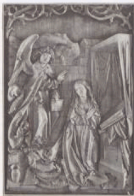
Maria Verkündigung aus dem Altarwerk.