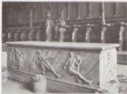
Sarkophag Papst Clemens II. im Bamberger Dom.

stellung, wie sie das Kaisertum unter den ersten Saliern gewonnen hatte, ein im Westchor des Doms aufgestellter Sarkophag, die Grabstätte des 1047 aus dem Leben geschiedenen Papstes Clemens II. Er war der erste jener deutschen Bischöfe, mit denen Heinrich III. in Folge des von ihm auch auf diesem Gebiete gewonnenen geradezu bestimmenden Einflusses nach einer Zeit schwerer kirchlicher Gebrechen den römischen Stuhl besetzte, um die Kirche wieder zu lichten Höhen emporzuführen. Aus Sachsen stammend hatte er vorher unter dem Namen Suidger seit 1041 den Bamberger Bischofsstuhl innegehabt als der zweite nach Gründung des Bistums. Nur schwer konnte er sich von dieser seiner Kirche trennen; seine Freundin, Schwester und Braut, seine keine Taube hat er sie genannt. Wie innig dieses Verhältnis war, bezeugt zur Genüge, daß er bis zu seinem Tode neben dem obersten Kirchenregiment auch noch die Leitung dieser Kirche beibehielt; ein Mann, fromm und wohlwollend, an dem man nur allzugroße Herzengüte als Fehler rügen wollte. Sein heißgeliebtes Bamberg sollte seine irdische Hülle aufnehmen, daher nun eben dieses Papstgrab im