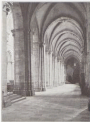
Aus dem Bamberger Dom.

Bischof Otto entstammte einer schwäbischen Familie. In früher Jugend war er nach Polen gekommen; dort konnte er Erfahrungen sammeln, die ihm sicher für seine spätere Missionstätigkeit von Wert waren. Bei seiner Ausbildung scheint der Unterricht in der Baukunst eine bedeutende Rolle gespielt zu haben, so daß Kaiser Heinrich IV., frühzeitig auf den begabten Mann aufmerksam geworden, ihn beim Speyerer Dombau verwendete. Es war dies in der Zeit der großen Kämpfe, vor allem zwischen Kaisertum und Papsttum. In einer Weise, die Bewunderung verdient, hat sich Otto damals wie auch später und überhaupt während seiner