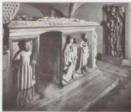
Grab W. Otto d. 5. in der St. Michaeliskirche zu Bamberg.

gewissermaßen wie ein vermittelnder Übergang angesehen werden. Auch wieder eine Säkularerinnerung von schwerwiegender Bedeutung, der Regierungsbeginn dieser aus den fränkischen Gebieten alter Reichsherrlichkeit, aus den Ländern am Mittelrhein stammenden Salier. Wie mit dem Namen