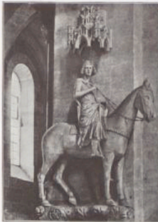
Der sogen. „Domreiter“ im Bamberger Dom.

denken bis heute dort lebendig geblieben; sein Grab galt als eine für die Pommern geheiligte Stätte. Aber auch für die ganze weitere Verbreitung des Christentums in den benachbarten wendischen Ländern war damit recht eigentlich der Grund gelegt. Mit Recht konnte Giesebrecht in seiner Geschichte der deutschen Kaiserzeit sagen, Bischof Otto sei nach dieser Richtung hin der Nachfolger Ottos des Großen geworden. Was dieser und seine in den nordöstlichen Marken eingesetzten Kriegsgewaltigen Markgrafen mit dem Schwert erzielten, das hat der Pommernapostel mit den unwiderstehlichen Waffen der Liebe und Güte in dauernder Weise geistig erobert. Und eben auf diese