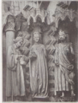
Kaiser Heinrich und Kunigunde an der Abampforte des Bamberger Doms.

Nicht ungern mache ich bei dieser Wanderung durch die Reiben unserer alten Kaisergestalten auf eine Bilderreihe aufmerksam, die einst an der Straße früherer Kaiserherrlichkeit, da, wo noch Goethe mit aufmerksamer Augen alte Kaiserherrlichkeit hatte beobachten und lebendig schildern können, ins Leben gerufen wurde, eine Sammlung, der man gar zu wenig Aufmerksamkeit mehr zuwendet. Es sind die lebensgroßen Kaiserbilder in dem bekannten Saal im Römer zu Frankfurt a. M.