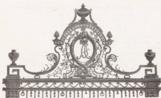
Vom Ausführgitter des Reichshofes zu Jägerhaus.