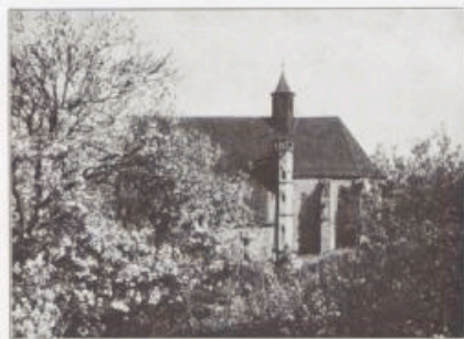
Herrgottskirche in Creglingen.

S on dem einen der beiden hohenzollernschen Territorien in Franken, der Markgrafschaft Ansbach, ist gelegentlich der tief einschneidenden Gebietsveränderungen, wie sie die Zeit der napoleonischen Kriege mit sich brachte, der weitaus größere Teil unter die Herrschaft Bayerns gekommen, und nur von den westlichen Grenzgebieten wurde einiges dem württembergischen Staate zugewiesen. Zu diesem letzteren gehörte Creglingen, eine kleine Stadt an der Tauber, ausgezeichnet durch Anmut der Lage, wie auch durch altertümlich malerischen Charakter. Ursprünglich vielleicht den Grafen von Rothenburg gehörend, war Creglingen dann frühzeitig an die Dynasten von Hohenlohe-Braunecf gekommen, in deren Besitzstand es eine nicht unbedeutende Rolle spielte; eine dort länger angesessene und danach sich benennende Ritterfamilie gehörte zweifellos zum Lehenhof dieser mächtigen Herren. Von großer Bedeutung war vor allem für diesen Ort, als Kaiser Karl IV. 1349 an Gottfried II. von Hohenlohe-Braunecf die Genehmigung erteilte, Creglingen zur Stadt zu machen und zu befestigen; aller Freiheiten und Rechte, wie die benachbarte Stadt Rothenburg, sollte auch diese neue Stadt sich erfreuen und zugleich einen Wochenmarkt halten dürfen. In dieser seitberigen territorialen Verbindung