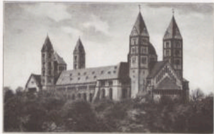
Der Kaiserdom zu Speyer.

Um es nochmals mit allem Nachdruck zu betonen: es ist eine tiefgreifende, mühevoll, aber in der Hauptsache wohlgedungene