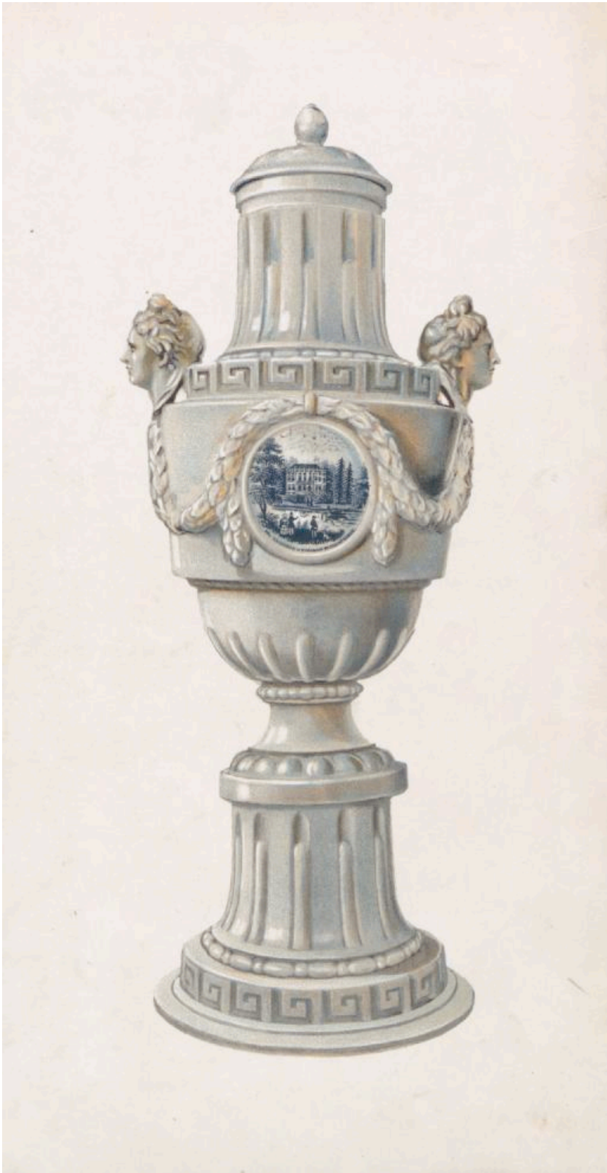
55/Franc 4105