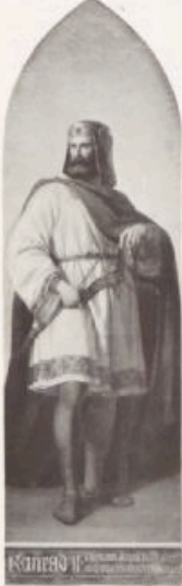
Kaiser Konrad II. im Römeraal zu Speyer a. 10.

Grund genug, dieser so hochbedeutenden Säkularerinnerung eine aufmerksame Betrachtung zu widmen. Aus dem Sachsenlande, aus Niederdeutschland, hatte diese Kaiserfamilie gesamt, aber mit jener Seitenlinie, aus der eben Heinrich II. hervorging und ihrer Verpflanzung nach Bayern war eine gewisse Verschiebung ihrer ganzen Stellung nach Oberdeutschland hin eingetreten, und es erfährt das nur noch eine weitere Verstärkung durch die von diesem letzten sächsischen Kaiser vollzogene Gründung des Bistums Bamberg, wo er dann auch seine letzte Ruhestätte finden sollte. Durch diese so bedeutsame Tat hatte auch in fränkischen Landen die Dynastie ein engeres Heimatrecht erworben, und es darf das Jahr 1024 auch als eine bedeutsame fränkische Säkularerinnerung gelten.