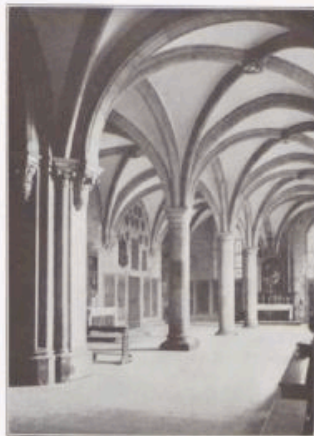
Die hl. Hagelkapelle des Bamberger Doms.

Von der mächtigsten Wirkung ist aber bei dieser Bamberger Kathedrale doch der Bau als solcher. Wohl kann er nicht die gewaltigen Maße der Längenenwicklung und des Querschiffs