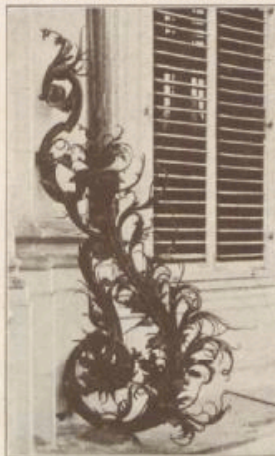
Gitter an der Residenz.

Nicht bloß einer eitlen Laune verdankte dieses gewaltige Bauwerk seine Entstehung, aus einem gewissen, durch eine längere geschichtliche Entwicklung erwachsenen Bedürfnis war es entsprungen. Die mehrhundertjährigen oft so heftigen Kämpfe zwischen der Stadt und den Fürstbischöfen, wie sie den damaligen Zeitverhältnissen entsprachen, hatten letztere ihre Wohnung auf dem Marienberg als dem die Stadt beherrschenden Höhenboll-