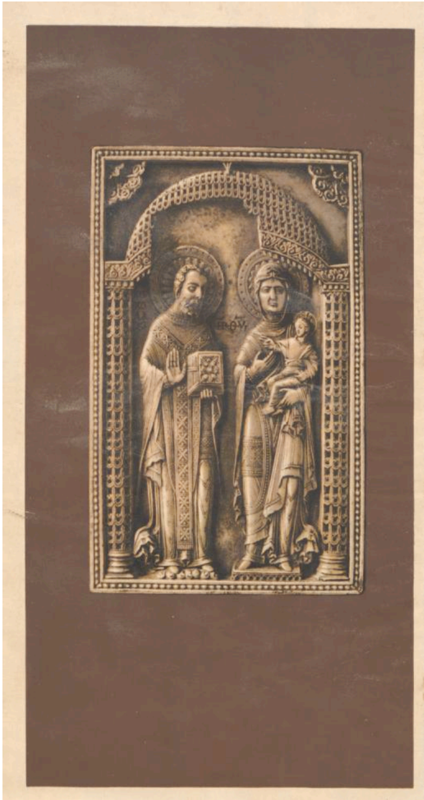
55/Franc 4105, © 2026 Universitätsbibliothek Würzburg