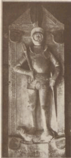
Grabbild des Ritters Peter von Randenader.