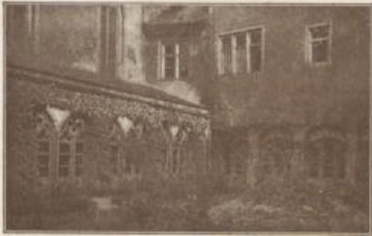
Aus dem Kreuzgang des Franziskanerklosters.

Zu den Bildern, die wiederholt schon früher, besonders im Jahrgang 1908 zur Geschichte des Würzburger Ordenshauses hier gebracht wurden, mögen diesmal zwei weitere hinzukommen.