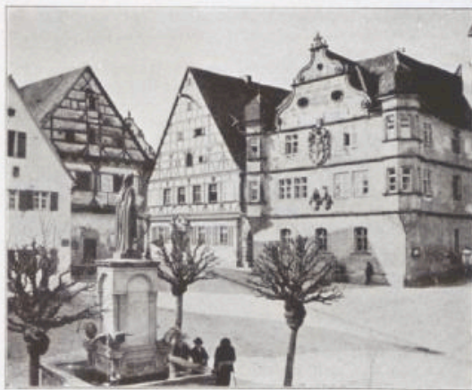
Martysian mit Durchbohrungsgehölze, 1891 Rathaus und Wolframs-Denkmal.

Ein zweifelloses Verdienst unserer Zeit ist es, eine Reihe von kleineren Städten in ihrem echt altertümlichen Reiz erst gewissermaßen neu entdeckt zu haben, nachdem man lange wie mit geschlossenen Augen daran vorübergegangen war. Dahin ist das