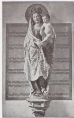
Madonna von Niermündener.

Zwei Altarwerke sind es, die besondere Aufmerksamkeit verdienen. Zunächst einmal der in der Mitte der Westkrypta freistehende Altar, mit dem die Grabstätte der Krankenapostel recht eigentümlich gekennzeichnet erscheint. Er steht in dieser seiner gegenwärtigen Gestalt wohl in Zusammenhang mit der lebhaftesten Bauzeit, wie sie für die Kirche in ihrer Gesamtheit in den zwanziger Jahren des 13. Jahrhunderts angehoben hatte. Bis gegen Mitte dieses Jahrhunderts erhielt dadurch das Ganze den einheitlich romanischen Charakter, der dann auf lange Zeit hinaus der darin vorherrschende geblieben ist, wobei allerdings zum Teil schon der Übergangstil sich geltend macht. Der Höhenraum dieser interessanten Altaranlage war für den Reliquienschatz bestimmt,