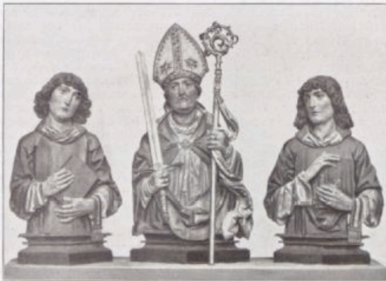
Die Stantenapfel von Nimenschneider.

Den eingreifenden Umgestaltungen, die, wie oben bemerkt wurde, das 18. Jahrhundert für Neumünster mit sich brachte, gehört, abgesehen von der mit dem Künstlernamen Greising verbundenen Westfassade mit der Freitreppe, insbesondere auch die Umgestaltung des Innern im Feingeschmack an. Einen bemerkenswerten Beitrag hierzu bot noch gegen Ende dieses Zeitraums die umfangreiche pompöse Hochaltaranlage, innerhalb deren der Tabernakel eine selbständige Partie bildet, deren Abbildung nach einer Neuaufnahme von L. Gundermann dahier gegeben ist; auch die anderen Bilder aus Neumünster entstammen dieser Anlage. Der 1778 vollendete vergoldete Tabernakel verdient als eine sehr