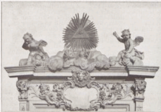
Vom Portal der Hofkirche in Würzburg.