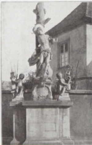
St. Sebastiansstatue bei St. Gangaip in Bamberg.