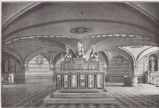
St. Kiliansaltar in der Westtreppe.

und strittig muß die Überlieferung über ihr Auftreten, ihr Wirken und ihr Lebensende angesehen werden. Aber eine uralte, tief im Boden des mainländischen Volkes wurzelnde Tradition, begleitet von hier aufbewahrten, die nationalen Schriftzüge jener Glaubensboten aufweisenden ehrwürdigen Schriftdenkmälern spricht zu laut für die Tatsache ihres Wirkens, als daß daran im allgemeinen zu zweifeln wäre, wie auch daran, daß sie die Ausführung dieses ihres Lebenswerkes mit dem Tode besiegelten. Nicht verkleinert darf ihre Bedeutung dadurch erscheinen, daß sie ihre Aufgabe noch unvollender hatten zurücklassen müssen und dann erst der große Kirchenorganisator der rechtsrheinischen Lande, der Angelsachse Bonifatius, wie anderwärts so auch hier energisch und erfolgreich das Werk zum Ziele geführt hat; unverflümmert bleibt ihnen der Ruhm des mühsamen Beginnens und Grundlegens. Insofern hatte es seine Begründung, daß St. Burkards des ersten Bischofs Kathedrale über dem Grabe der Frankenapostel entstanden ist, an der Stelle des heutigen Neumünsters. Aber schon 855 sank dieser erste Dom in Asche. Warum sodann Bischof Arno für den Neubau die jetzige Stelle wählte, ist nicht bekannt. Daß der dadurch herbeigeführte Wegfall einer monumentalen architektonischen Auszeichnung der ehrwürdigen Grabstätte darauf