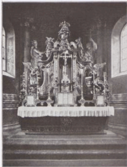
Lehrstuhl des Johannis.

dem so berühmt gewordenen Kreuzgangrest! Dazu dann noch die daran sich anschließende Tradition über Walther von der Vogelweide, die neustens noch eine bedeutsame Vermehrung