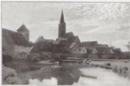
Wolframs-Eisenbahn von Eßen.

daß ein Zeitgenosse urteilen konnte: „Iren munt nie baz gesprach“; ein Dichtergenius, ausgestattet mit lebhafter Phantasie, hochpoetischer Gestaltungskraft, ebenso sehr Idealist, wie Realist, von feinem psychologischen Empfinden und tief religiöser Weltanschauung.