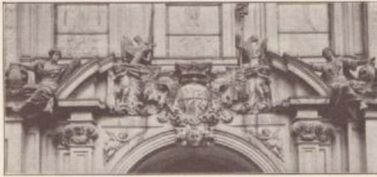
Vom Portal des Fürstenhauses im Juliusospital zu Würzburg.