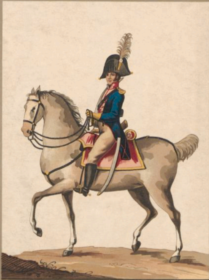
55/Franc 4105, © 2026 Universitätsbibliothek Würzburg