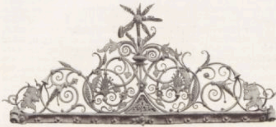
Schmiedearbeit an den alten Teilen des Würzburger Rathauses.