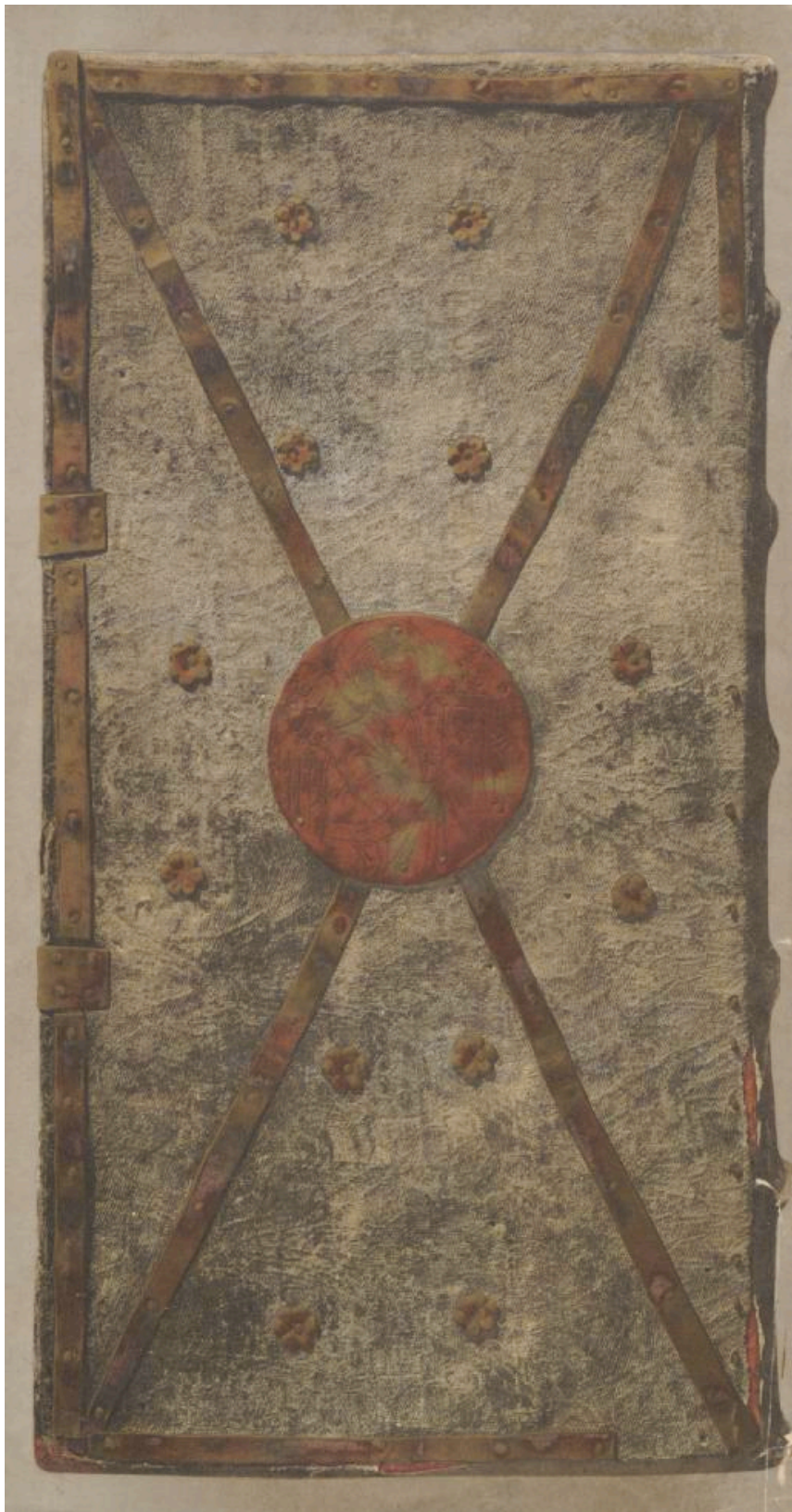
55/Franc 4105