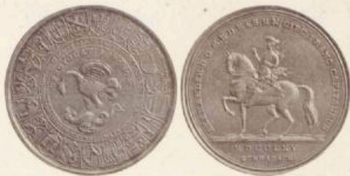
Zwei Medaillen auf die Markgrafen Christian von Bayreuth und Karl Alexander von Ansbach-Bayreuth als fränkische Reichsbristen.